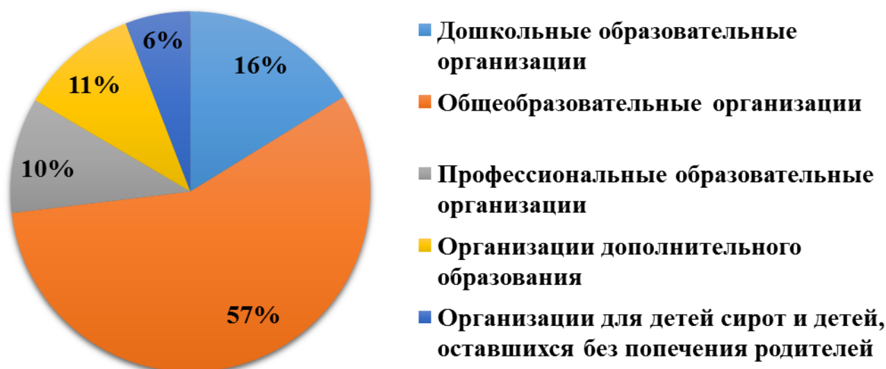
Рисунок 1. Распределение объектов проверок по типам

Распределение объектов проверок по типам представлено на рисунке 1.