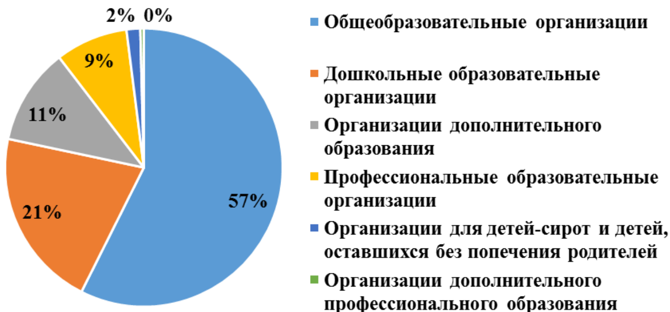
Рисунок 1. Распределение объектов проверок по типам

Распределение объектов проверок по типам представлено на рисунке 1.